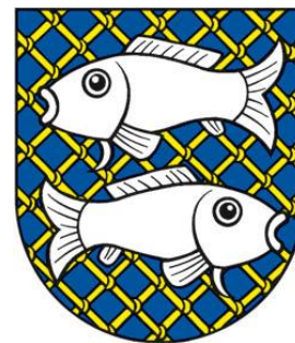
Obrázok 2 Erb obce

Erb obce Lovča tvorí modrý štít prekrytý zlatou šikmou sieťou, preložený dvoma striebornými položenými rybami, spodnou obrátenou.