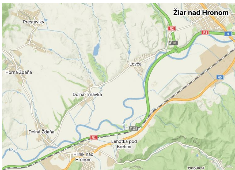
Obrázok 1 Mapa polohy obce

Obec Lovča leží uprostred Žiarskej kotliny prevažne na pravostrannej nive rieky Hron, na severovýchode susedí s okresným mestom Žiar nad Hronom, na východe s obcou Ladomerská Vieska, na juhu s obcou Dolná Ždaňa a na západe s obcami Dolná Trnávka, Horná Ždaňa a Prestavky. Nadmorská výška obce v jej strede je 243 m n. m., v chatári 231 - 335 m n. m.